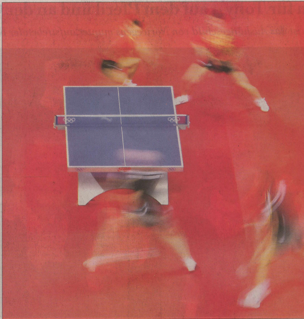
Roter Teppich für Tischtennispieler – China strebt Gold in allen Disziplinen an.